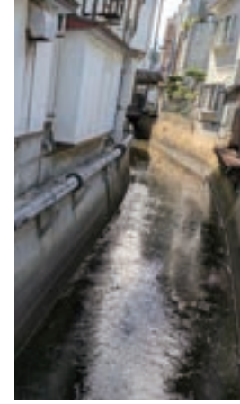
常盤井壺岐の七名水・武生水井戸・亀川： 命の名水循環・ゾーン