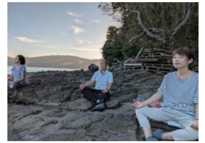
寒神社・水域里道・市場： 触）暮らしと祈りの壺岐る道・ゾーン