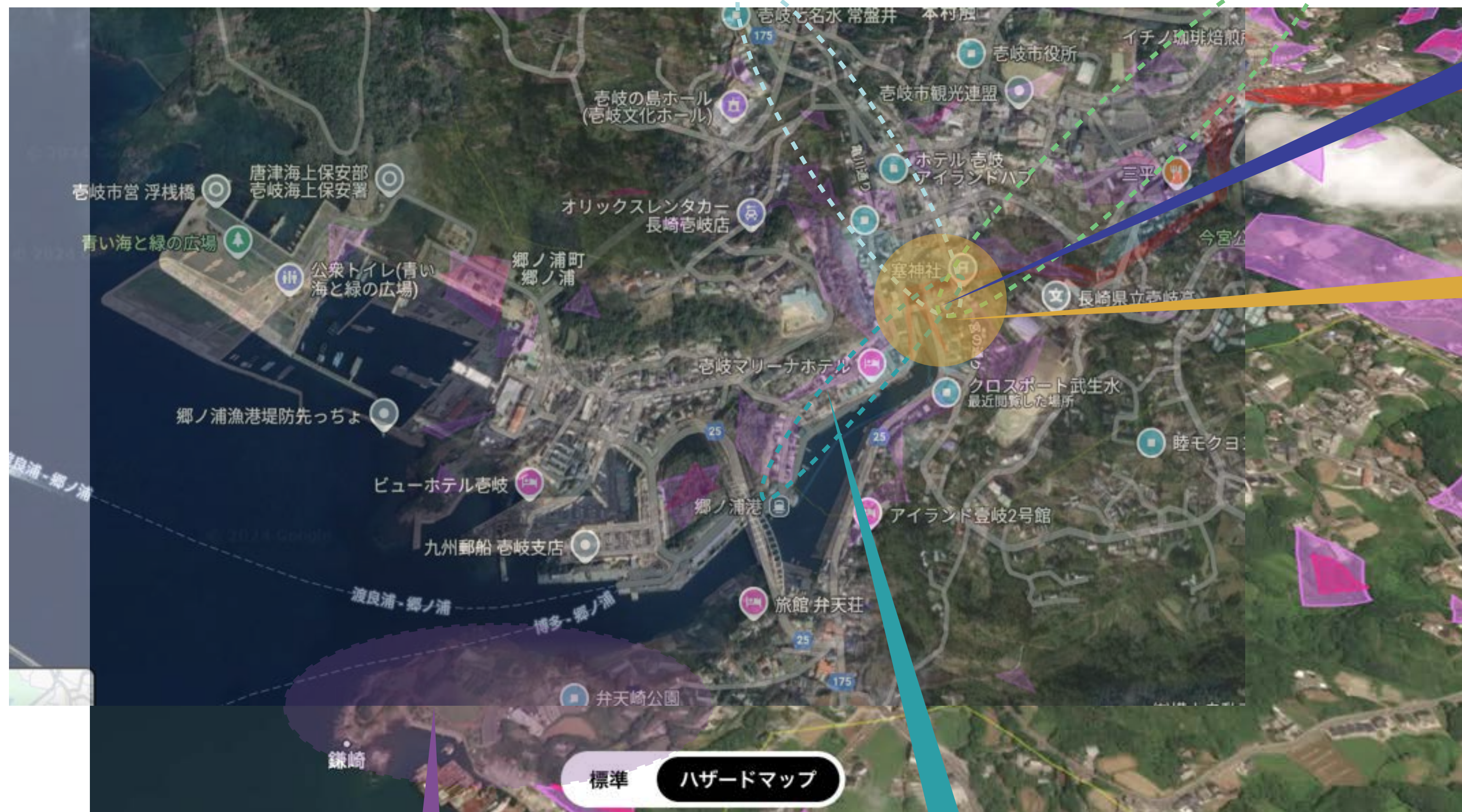
徒歩スタートの拠点 患者と市民と訪問者が 暮らしコンテンツで交差