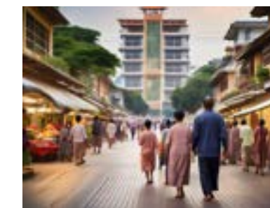
商店街・光武病院・図書館： ケアエコ・ビレッジゾーン